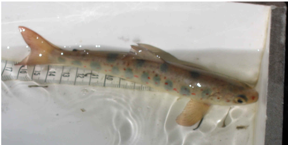
Einjähriger Lachs bei der Befischung im April 2005

Im Mittelpunkt unseres Interesses steht nach wie vor der Lachs: In diesem Jahr haben drei Kontrollbefischungen stattgefunden. Die Befischungen vom 05. April und 16. Juli 2005 wurden gezielt auf den Nachweis von Junglachsen durchgeführt.